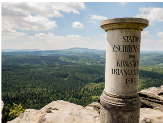
Triangulační bod na Velkém Zschirnsteinu