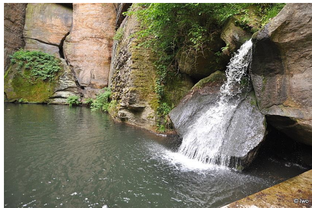
Vodopád a jezírko na Klokotském potoku