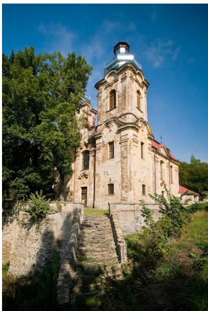
kostel Navštívení Panny Marie ve Skokách