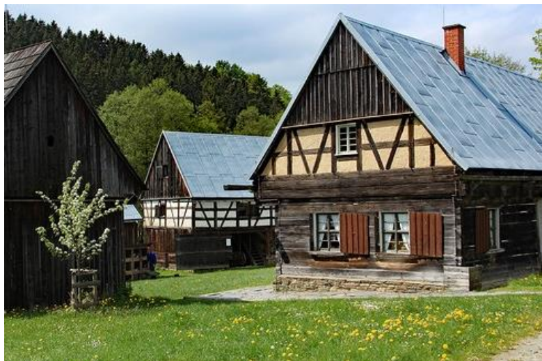
skanzen Eubabrunn u Erlbachu (start a cíl pochodu)

Doprava na start pochodu: Smluvním autobusem ze Sokolova v 8:10 hodin od autoškoly Vyskočil – Šenvert (100 m od vlakového nádraží) po příjezdu vlaků od Karlových Varů (os7002) a Chebu (os7025). Autobus pojedě přes Kraslice a Klingenthal.