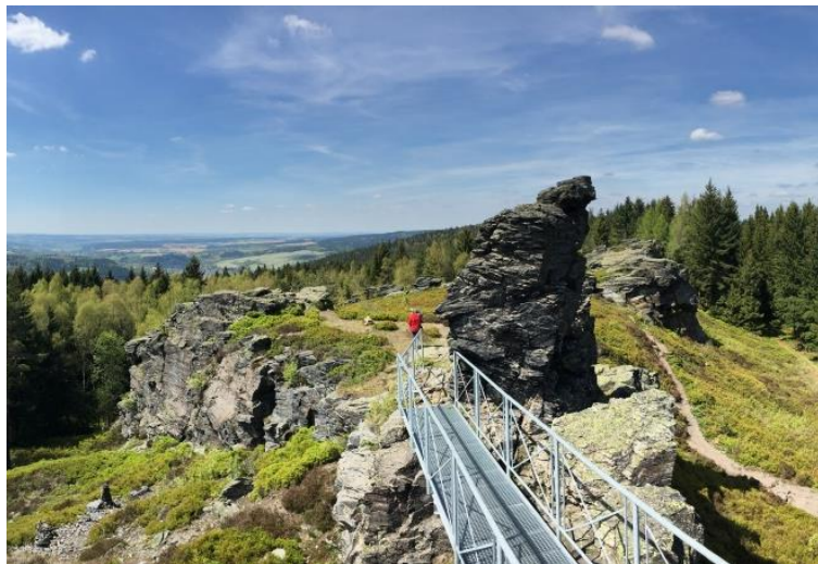
Vysoký kámen u Kraslic