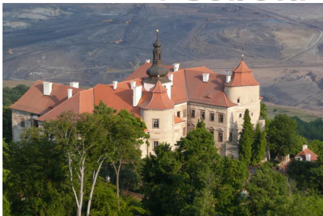
Zámek Jezeří