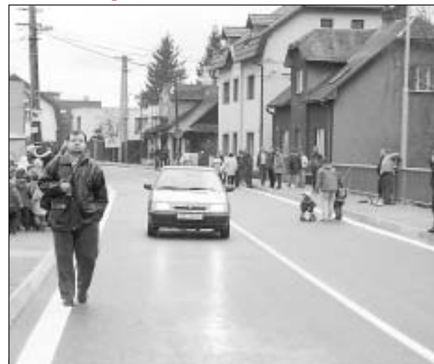
Podávalo se nám zachytit první auto, které přes nový most po jeho oficiálním otevření přešlo.

Už od 2. prosince mohou motoristé využívat nového mostu přes řeku Morávku mezi Frýdeckou částí Na Veselé a Starým Městem.