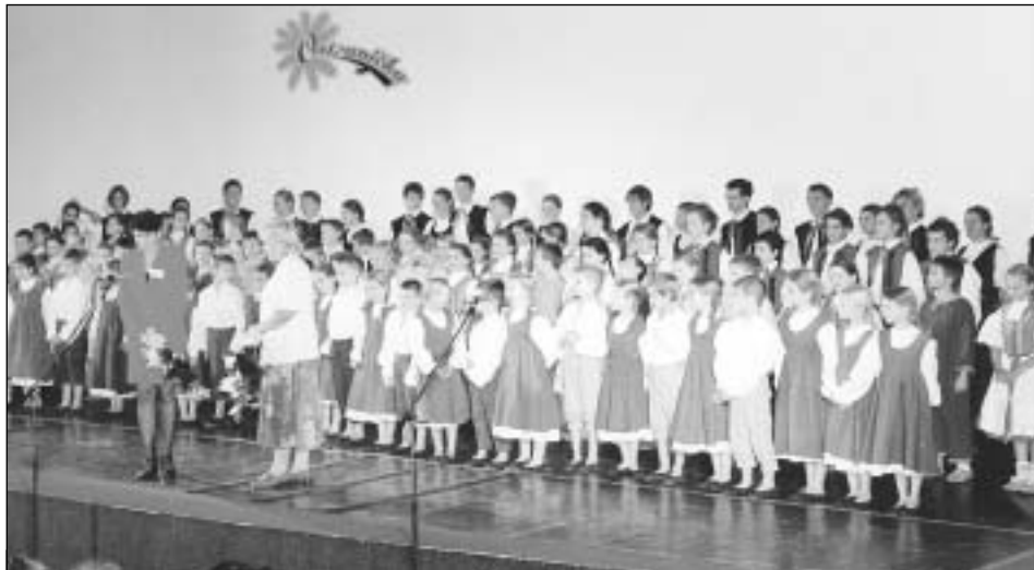
Folklorní soubor Ostravička