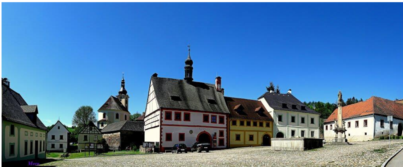
Foto: náměstí v městečku Úterý - start a cíl pochodu

Startovné: 55 Kč dospělí, 25 Kč děti, 135 Kč rodina