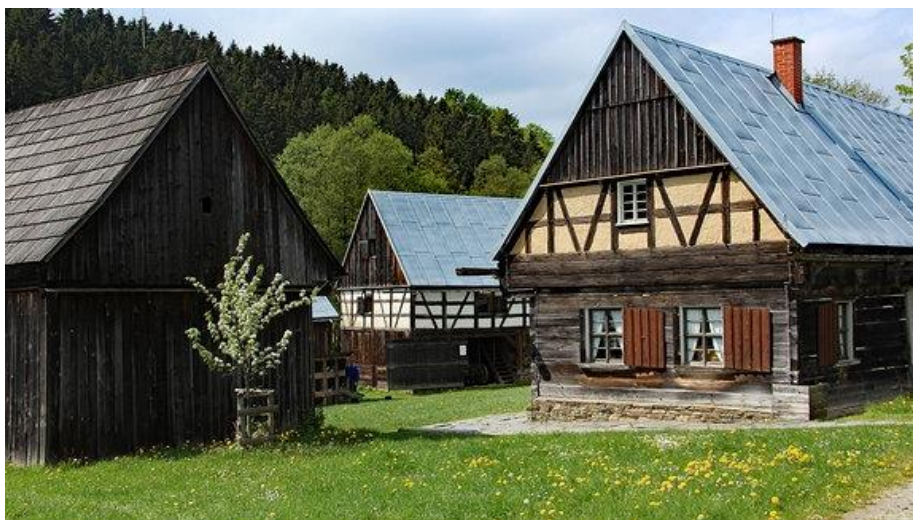
skanzen Eubabrunn u Erlbachu (start a cíl pochodu)

Doprava na start pochodu: Smluvním autobusem ze Sokolova v 8:10 hodin od autoškoly Vyskočil – Šenvert (100 m od vlakového nádraží) po příjezdu vlaků od Karlových Varů (os7002) a Chebu (os7025). Autobus pojedje přes Kraslice a Klingenthal.