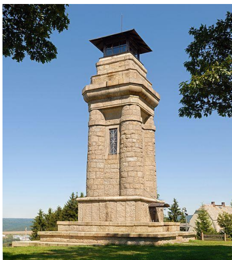
Bismarckova rozhledna u Markneukirchenu