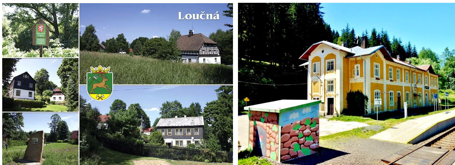
Pohlednice Loučné (zdroj: web Jindřichovic)