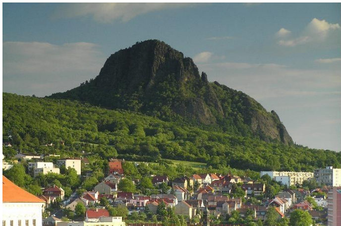
Znělcová kupa Bořeň (foto Mapy.cz)