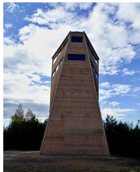
rozhledna Břasy – Na Vrchách

Základní trasa 18 km – lze krátit: Smědčice Bus (10:34) – Sedlecko (možno vystoupit z busu v 10:40 = 15 km) – údolí Korečnického potoka – Všenice (možno vystoupit z busu v 10:45 = 12 km) – Stupno (možno vystoupit z busu v 10:49 = 10 km) – Amerika (možno odbočit k rozhledně Břasy = celkem + 1,5 km) – Újezd u Svatého Kříže – Radnice nám.