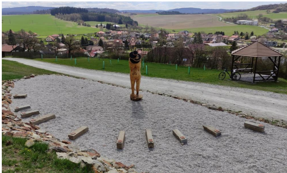
Unikátní sluneční hodiny v Radnicích