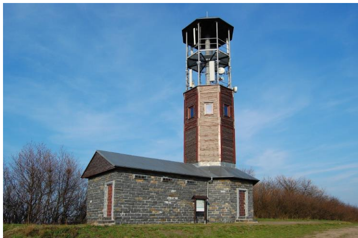
Vítova rozhledna u Náchkovic

Výlet bude rozdělen do dvou skupin, abychom se pohodlně vešli do historického autobusu Škoda RTO. Odjezd a návrat obou skupin bude ve stejnou dobu. Skupina A pojedje přes Zubrnickou museální železnici a Skupina B vystoupá na Vítovu rozhlednu u Náchkovic s výhledy do Českého středohoří.