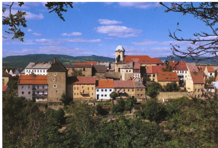
Historické městečko Úštěk