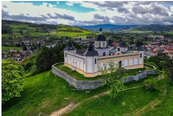
Andělíček nad Sušicí

Základní trasa 10 km: Hrádek u Sušice žst. – zámecký park Hrádek – Odolenka (zaniklé lázně a pionýrský tábor) – rozhledna Svatobor – vyhlídka Stará vodárna – Sušice centrum Upozornění – na trase převýšení 400 m. Kdo bude chtít jít trasu bez převýšení, nabízí se po příjezdu do Sušice přejet autobusem do Červených Dvorců a dojít po červené turistické značce pohodlnou cestou kolem Otavy do centra Sušice (5 km).