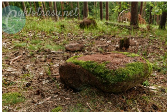
Méně známé Nečemické kamenné řady

Trasa : Holedeček žst. – Nečemické kamenné řady – Nový Svět – Výrov – Kozinecká stráž – vyhlídka U Petra a Pavla – Konětopy (18 km)