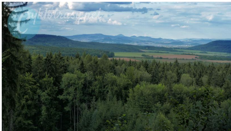
Krajina přírodního parku Džbán s výhledy na České středohoří