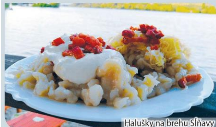
Halušky na brehu Sĺňavy

Letná terasa s výhľadom na hladinu jazera a panorámu Považského Inovca sa nachádza pri Lodenici v Piešťanoch, priamo na cyklotrase okolo Sĺňavy. Zákazníci sa radi zastavia na ze-