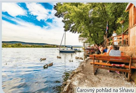
Čarovný pohľad na Sĺňavu