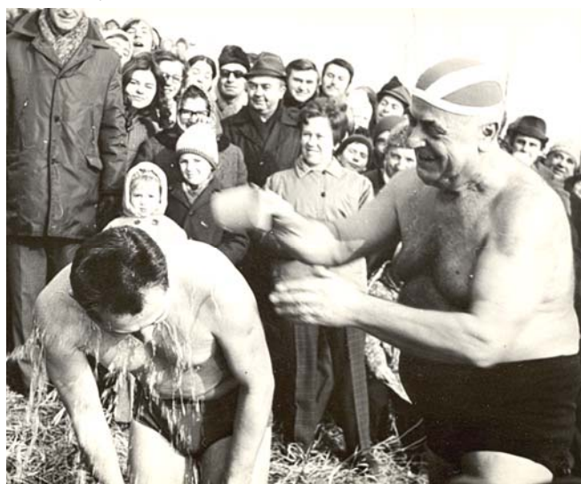
Snímek z Pardubic.