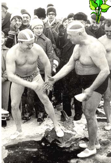
Snímek z Prahy – Bráníka.