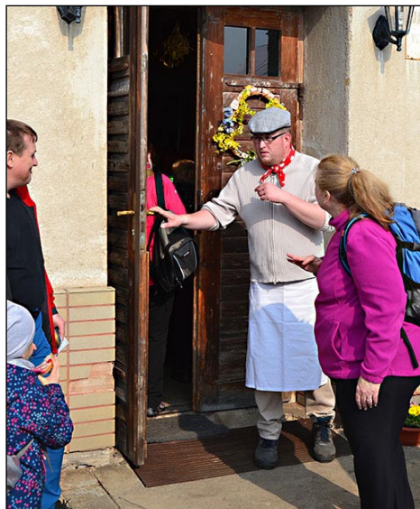
Provést mlýnem stovku dychtivých zájemců byl také výkon

U Hálůva mlýna se přímo u cesty daly koupit předražené uzené klobásky a u Šmelcovny panoval pravý byznysový chaos jakési nesourodé