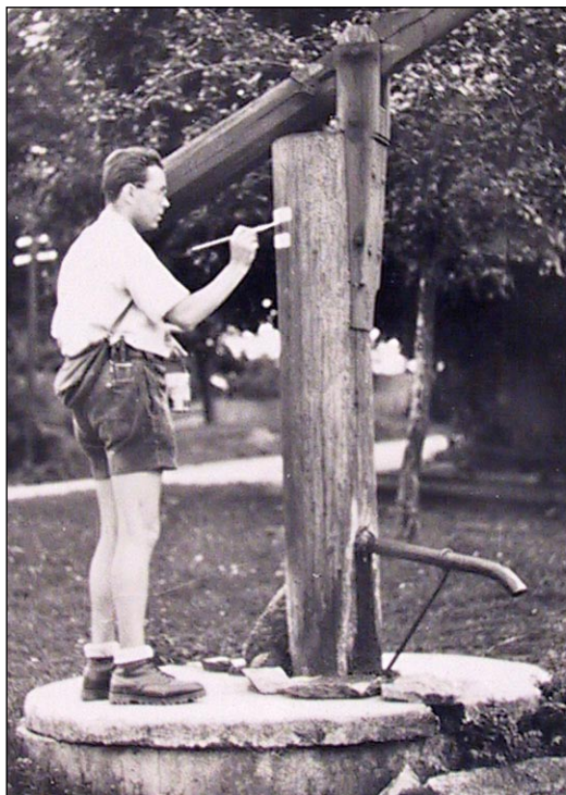
Při značení (1952)

Obnova turistického značení vyjde ročně na zhruba 15 milionů korun, a to nepočítáme „mzdové“ náklady, protože značkaři svou činnost provádí