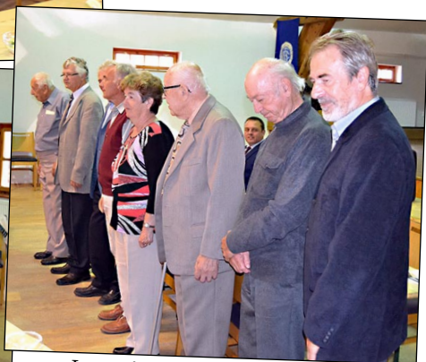
Laureáti zlatých medailí své ocenění konečně obdrželi v důstojných podmínkách odpovídajících významu