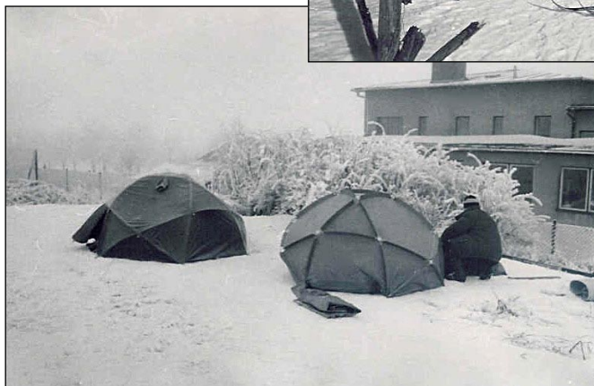
Zimní táboření Rokytno