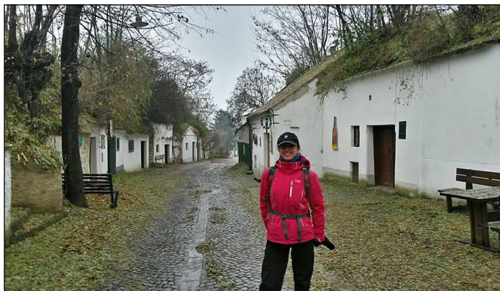
Sklepy v Poysdorfu

Předpověď počasí nebyla příliš pozitivní a také čtvrteční ráno jí dalo zapravdu, zatažená obloha s deštěm odradila i některé ohlášené účastníky.