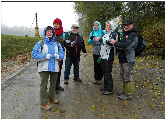
Alenina skupina na cestě z Poysbrunnu do Falkensteinu

Takto by to možná vyznělo jako strohý popis trasy, ale to nejlepší na konec. Jak jsme se tak kochali nádhernými sklepy ve falkensteinské