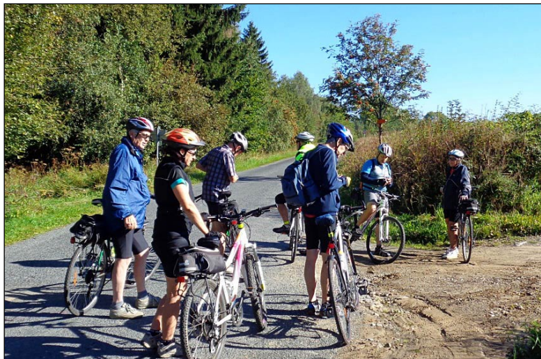
Cykloturistika v Českém lese

Historie se začala psát v roce 1945. Vznik je spjat se zaměstnanci brněnské pošty, kde vznikl turistický kroužek, který pořádal pro zaměstnance turistické zájezdy a výlety. V roce 1946 pak došlo k ustavení výboru oddílu a tím začala