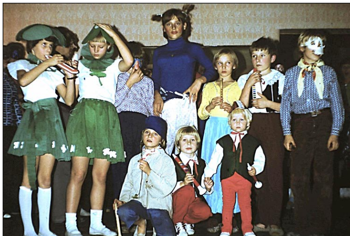
Ze zájezdu do „Neznáma“ (Dobrošov 1977)