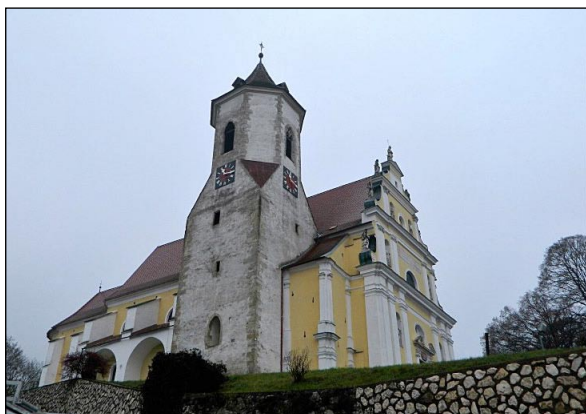
Kostel sv. jakuba Většího ve Falkensteinu