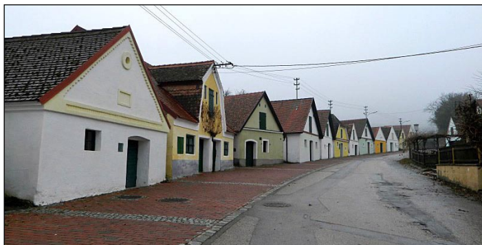
Sklepní ulička ve Falkensteinu

poysdorfskou starobyloou sklepní uličkou, vystoupali úbočím hory Galgenberg k Hubertovu kříži a seběhli k falkensteinské vinařské uličce, jež měla zcela jiný ráz. Nachází se zde 65 lisoven vína, sklepy zde fungují už od roku 950 a víno