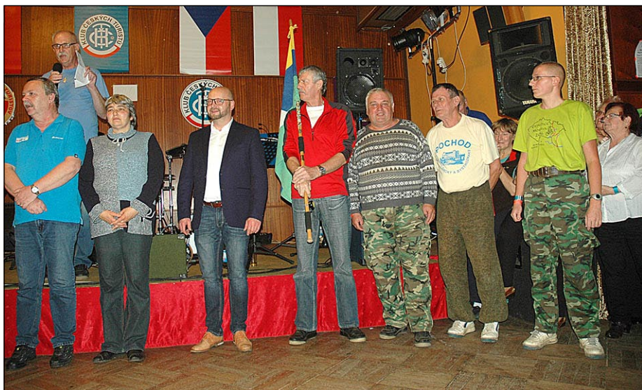
Zástupci Bučovic na předávání puchýřovské štafety

Na Poslední puchýře tradičně vyrazí i skupina bučovických turistů, někteří už více než třicet let. Letošní výlet byl však pro nás poněkud zvláštní. Už při odjezdu jsme totiž všichni věděli, že dalšího ročníku se nezúčastníme. Důvod naší absence v seznamu přihlášených účastníků je velmi prozaický: ústřední orgány KČT svěřily pořádání 46. ročníku pochodu Za posledním puchýřem v roce 2017 právě do rukou bučovických turistů.