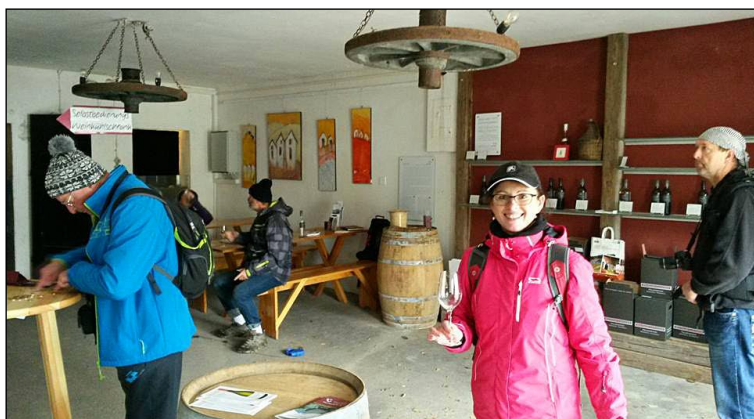
V samoobslužném sklepe ve Falkensteinu – systém fungování připomíná Lesní bar v Jeseníkách