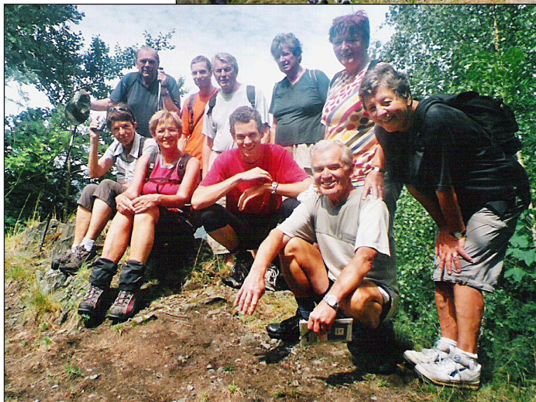
Lužické hory, Loupežnický vrch (2008)