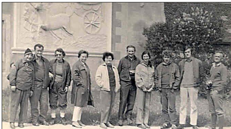
Historické foto z akce pěších turistů