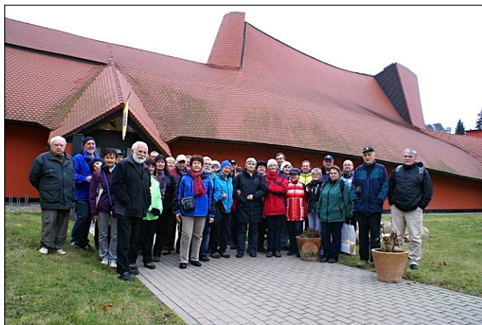
Účastníci semináře před Moravským kartografickým centrem