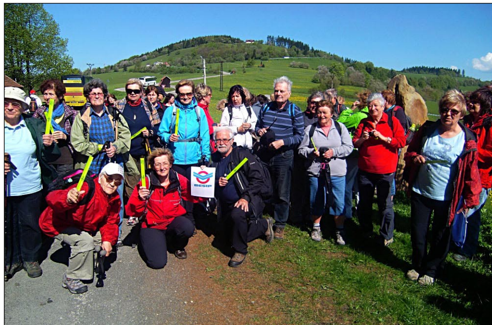
Přátelství bez hranic (2016)