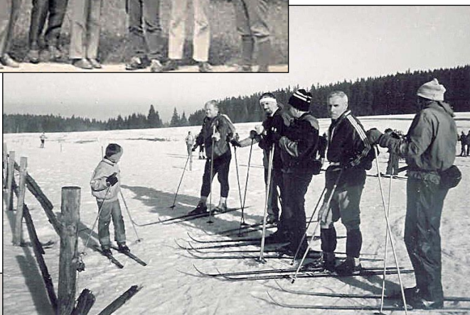
Lyžařský přejezd Šumavy