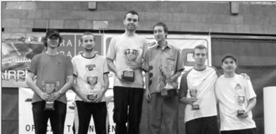
Czech Open - open doubles