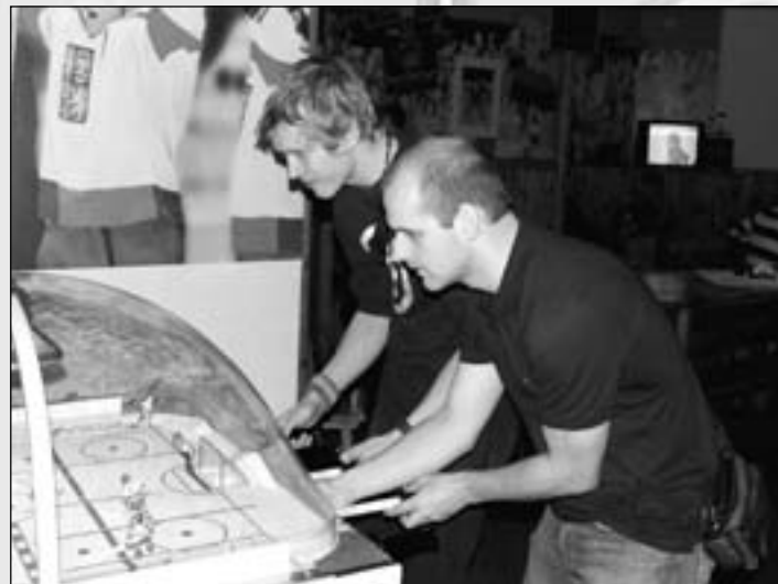
Madlo jako madlo